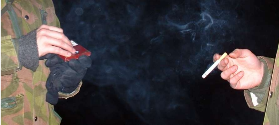
Kaksi Isänmaan Miestä, mutta eivät isänmaan, vaan Bolivian ja Guatemalan asialla

kä kaikkien valtion virastojen eteen tuodaan pieniä tupakkatynnyreitä. Tynnyri mitoitetaan siten, että normaalikokoinen aikuinen mahtuu juuri ja juuri kyyristymään tynnyriin tupakoinnin ajaksi. Tynnyrin kylkeen asennetaan 12V laitetuuletin, jonka ottama huippuvirta ei saa ylittää 400 mA. Laitetuuletin asennetaan siten, että se tuo raitista ilmaa tupakkatynnyriin. Tynnyrin vastakkaiselle puolelle asennetaan halkaisijaltaan 80 mm polyeteeniputki, ja 90 asteen muhvi savukaasujen poistoa varten. Poistoputkeen asennetaan jatkuvatoiminen katalysaattori. Tynnyrin seinään sisäpuolelle asennetaan automaattileimasin, joka leimaa tupakoitsijan otsaan "Olen tänäänkin polttanut"-leiman.